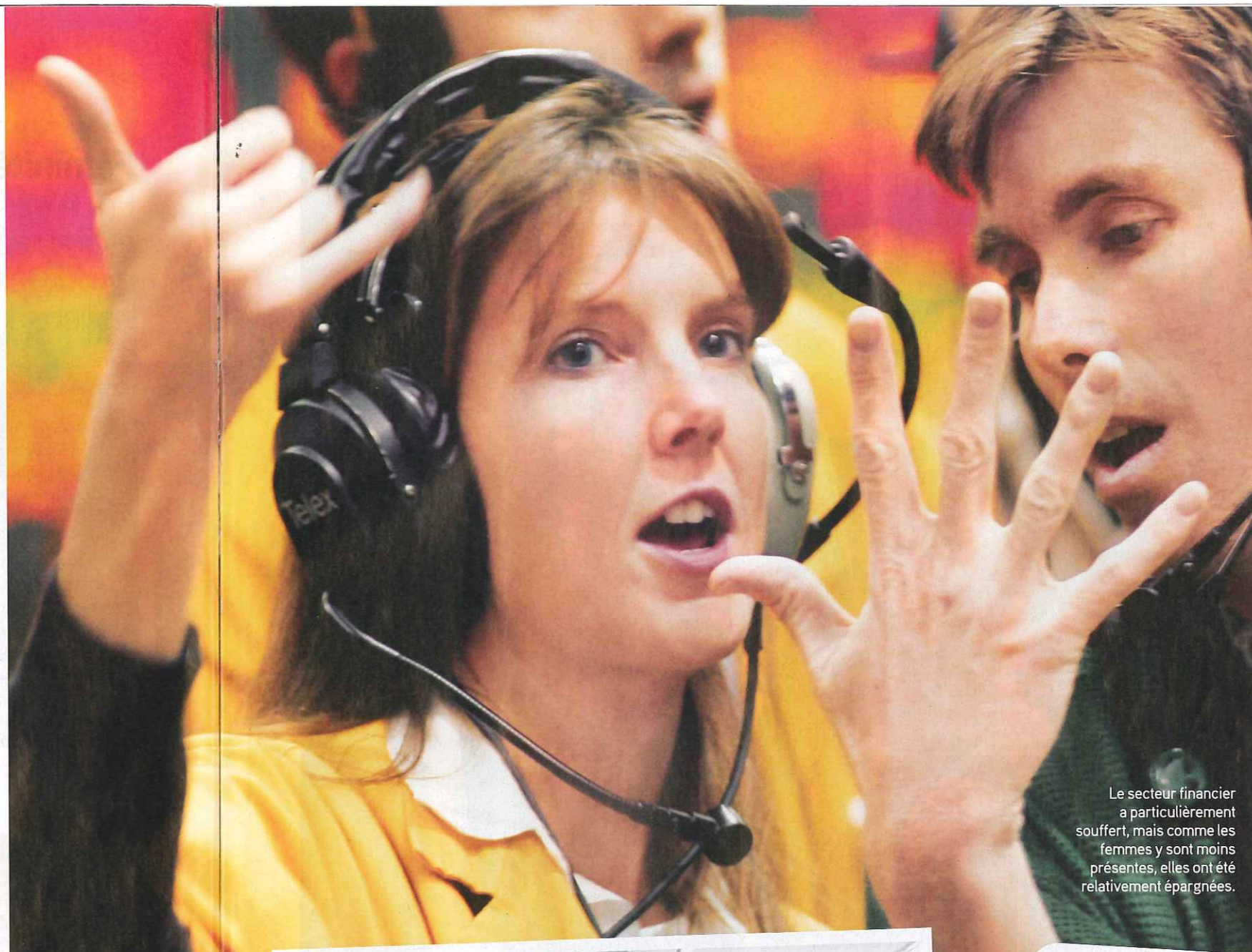
Le secteur financier a particulièrement souffert, mais comme les femmes y sont moins présentes, elles ont été relativement épargnées.