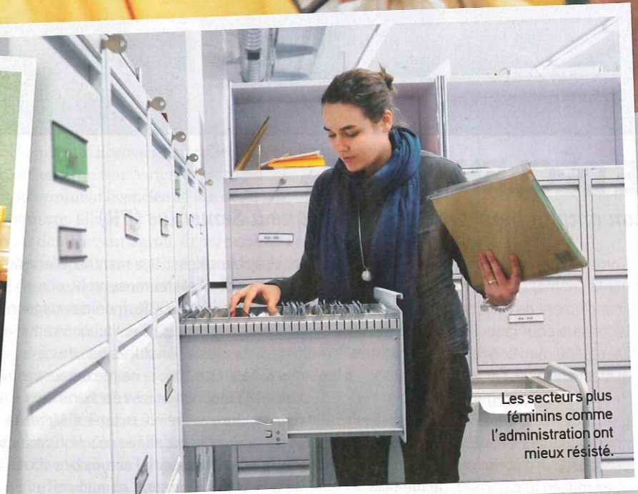
Les secteurs plus féminins comme l'administration ont mieux résisté.